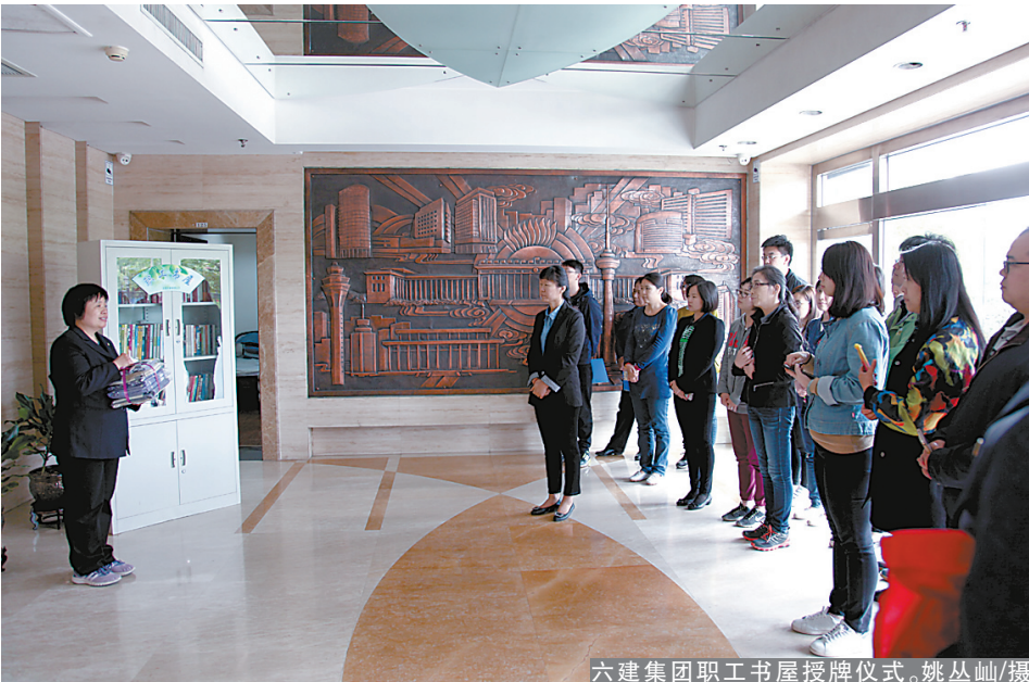
六建集团职工书屋授牌仪式。

总承包部选购了《党的十八届六中全会精神学习辅导百问》《结合案例学党纪这些“红线”当警惕》《中国共产党纪律检察机关监督执纪工作规则》《纪律的尺度》《国企改革12样本》等一批图书,让广大员工通过阅读相关书籍,加强警示教育学习,提