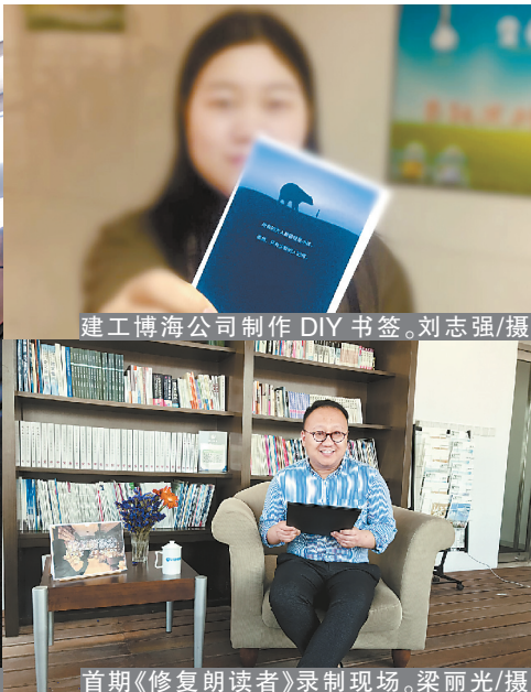
首期《修复朗读者》录制现场。

建工博海公司举办“阅读 让我们的世界更丰富”主题DIY书签活动,发动大家挑选自己最喜欢的书中的一句话,进行汇总整理后,配上意境相符的背景图,制作出了一个精美的书签。此次活动鼓励大家分享、