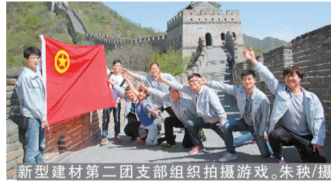
新型建材第二团支部组织拍摄游戏。