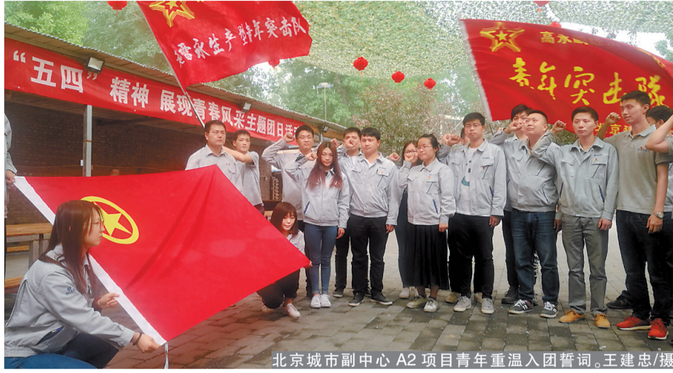
北京城市副中心A2项目青年重温入团誓词。

过程中,大家克服困难、互相扶持,共同缓解跑步中的疲劳,一起向前进发。此次活动使项目部员工锻炼了体魄,增强了团队协作和全民健身意识,并为“奔月计划”贡献了70公里。 此外,在“天舟一号”发射当天,由于项目部距离发射观测点近,便在路边架设望远镜,专门为前来观赏火箭升空过程的游客指路,大大缓解了人流量激增带来的交通拥堵问题,得到了游客和当地百姓的一致好评,使建工地牌在海南本地更加响亮。