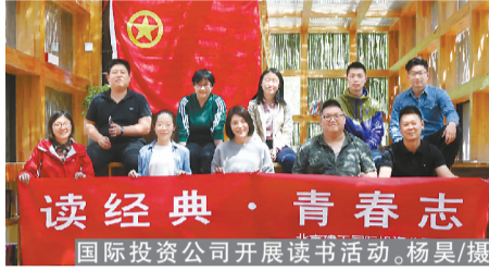
国际投资公司开展读书活动。