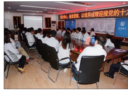
通州两站一街项目部