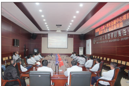
国瑞·西安金融中心项目部