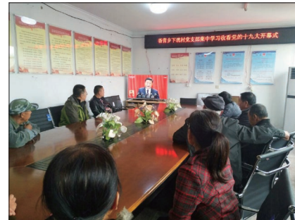
共建单位香营乡下垈村党支部