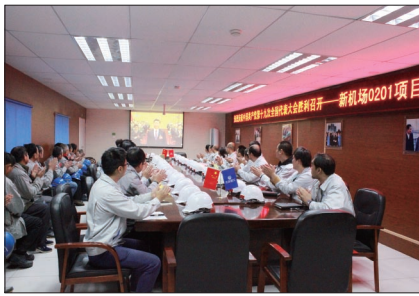
新机场安置房0201项目部