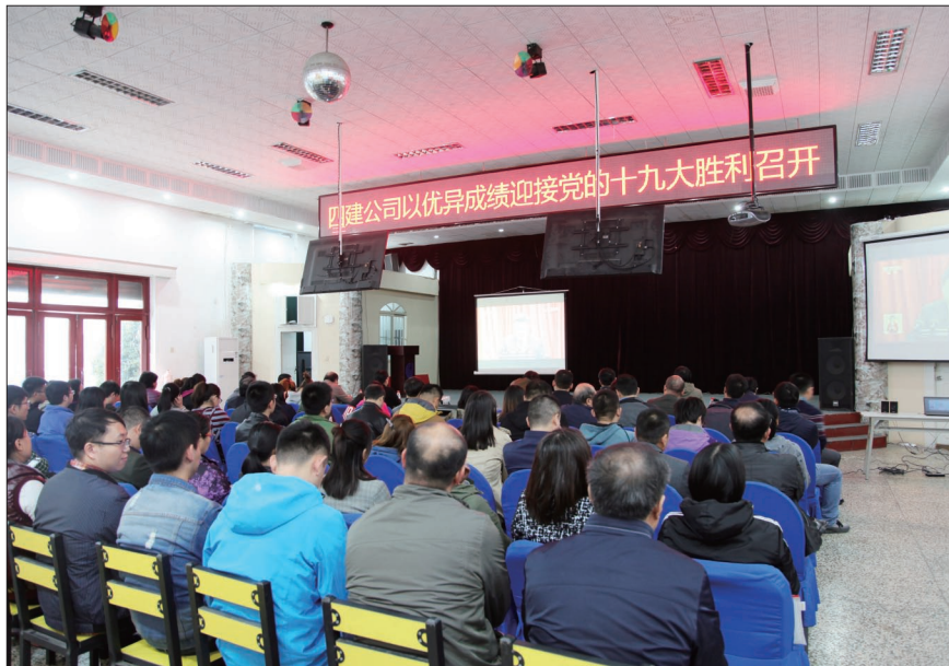
公司组织收看党的十九大开幕式