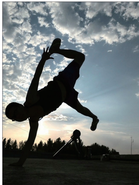
二等奖 朝阳舞者 作者:严石