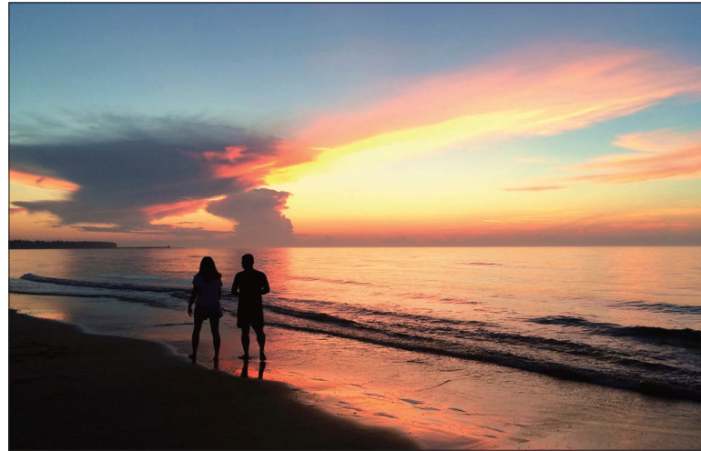
三等奖 博鳌日出 作者:李政