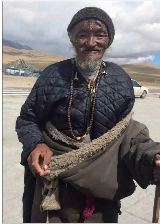
一等奖 老者 作者:黄进雯