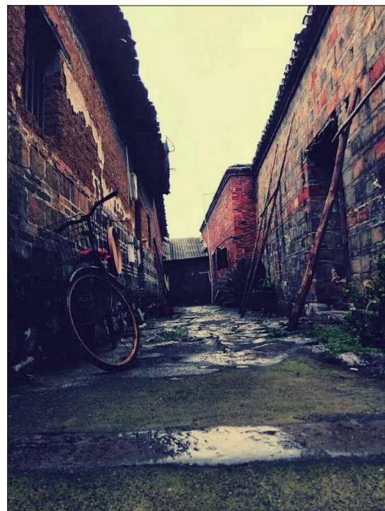
二等奖 岁月 作者:梁雪