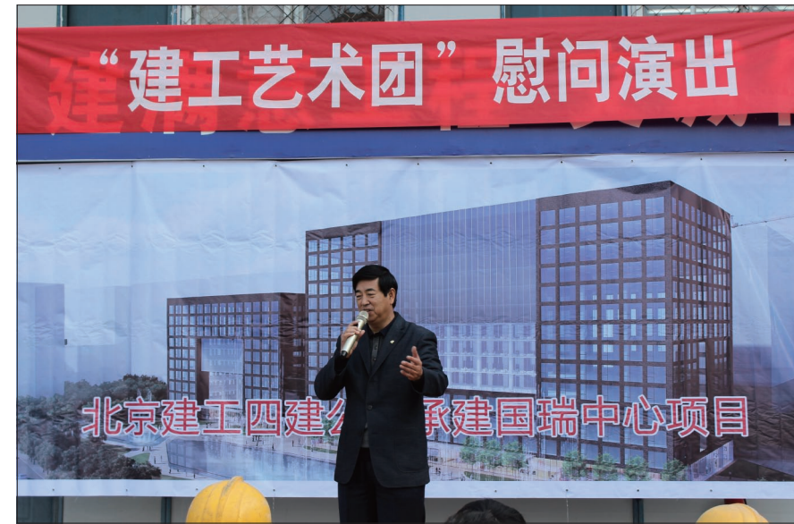
芦书记随建工艺术团到工地慰问演出