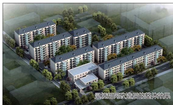
灵境胡同改造后的整体效果

据了解,灵境胡同12号院地处西城核心地段,在工程施工过程中存在诸多难题。一是工程是带户施工,施工期间居民不离楼,其安全、生活、出行都是大问题;二是12号院紧邻中南海,地处核心地带,车辆、人员、施工环境等方面的管理非常严格,不能有半点闪失;三是院内场地狭小,施工作业面