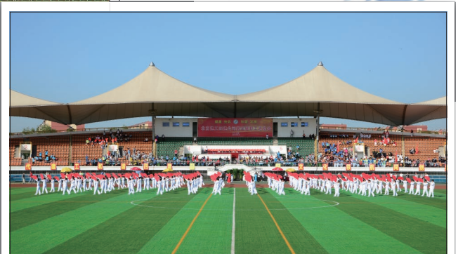
150人的太极扇表演，气势恢宏！在《中国功夫》的伴奏下，气势磅礴、刚柔并济、振奋人心。