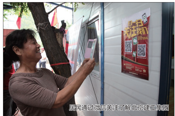
居民通过微信关注了解北京建工集团

借助于四年的老旧小区改造经验,北京建工四建在工作过程中,逐步摸索出了一套合理的施工流程和完备的质量保证体系,包括:通过条幅宣传、致居民公开信、挨家挨户上门宣传等各种形式提前做好通知和居民沟通工作,大力宣传整治改造的重要意义和分段施工的时间节点,为和谐施工做好了铺垫;在保证居民正常生活及个人安全的同时,项目部还在预定工期内合理安排时间,尽量避免扰民行为出现,特别是在居委会协助下准确掌握每个单元门出行不便的老人情况,搭设临时无障碍通道方便残障人员出行。在这一方面,四建公司还涌现出一批深受小区居民爱戴的好工人、好党员,如曾任