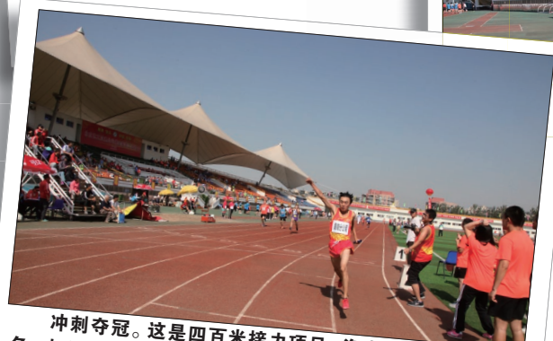
冲刺夺冠。这是四百米接力项目, 海南分公司夺得第一名。本次运动会跑步类项目涵盖男子100、1500、3000米及女子60、800、1500米, 角逐最激烈