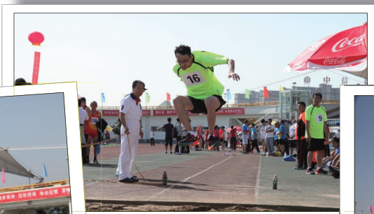
跳远, 此项目同样设置有女子组参赛