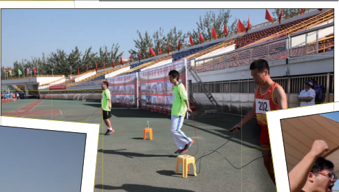
跳绳, 趣味项目竞赛, 同时还有踢毽及俯卧撑等