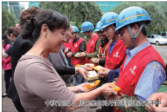
中秋节当天,居民亲自将月饼送到建设者手中

老旧小区改造工程,并不像平地起高楼那样的普通的建筑施工。在造甲街南里小区,记者了解到,该小区楼体最为分散,13栋楼分布在7个单院内,涉及6家物业,这给施工带来了不少的困难和挑战。不仅如此,此次老旧小区节能改造还存在场地小等诸多不便,总承包管理和现场协调管理难度大,更重要的是抗震加固改造技术要求高,土建施工、机电安装工程不仅要设计先进、有质量保证、工程齐备,还要体现居民使用过程中的安全性和环保性,进一步增加了工程的施工难度。项目施工人员告诉记者,为做好前期沟通工作,项目部在社区居委会配合下召开老旧小区改造工作协调会,详细向居民介绍了施工改造方案,耐心听取社区居民对此项改造工程的的具体想法,并与居委会的书记、主任对居民所提出的问题进行深入、细致、耐心的解答,解除居民的困惑。针对居民关注较多的室温问题,施工方表示此次节能改造完工后,预计在采暖期间,居民家中室内温度能提高4℃左右。