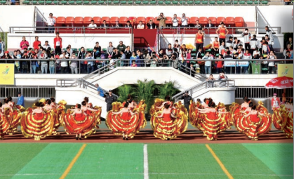
西班牙斗牛舞表演，飞舞的红色金边裙摆和时转时停的一致步调，随着斗牛士进行曲跃动在观众眼前