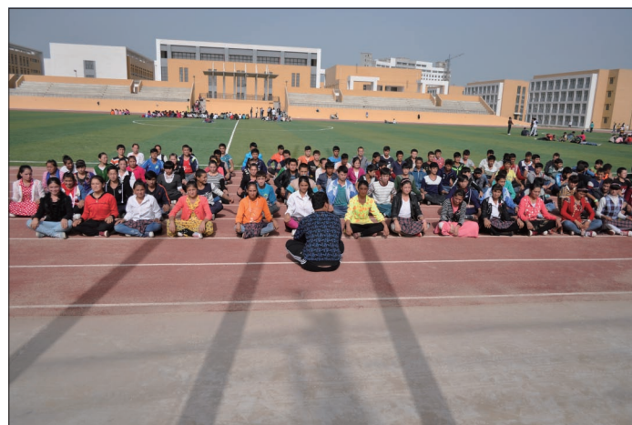
▲ 在墨玉县北京中学的体育场上, 孩子们正在准备上课

墨玉县北京中学建设工程自2013年4月1日正式开工以来, 为了确保工程高质量早日交付使用, 北京建工四建援疆将士按照现场情况将工程进度细化到每小时、每个工种, 并及时解决材料运输、外围关系、资金、二次深化设计等各种难题, 为工程的有序推进提供了强有力的保障; 管理干部和一线工人基本上是两班倒, 白天赶进度、晚上抢进度, “5+2”、“白+