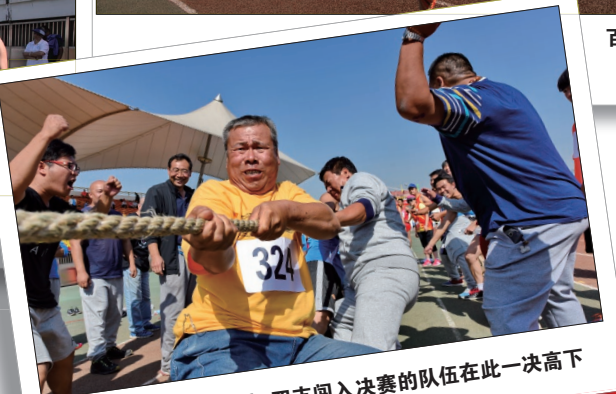
拔河比赛异常激烈, 四支闯入决赛的队伍在此一决高下