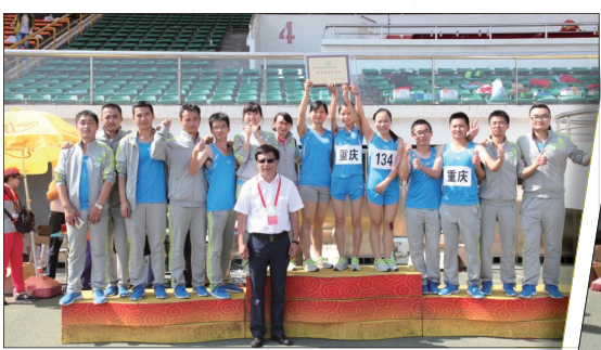
公司领导为获奖个人及单位颁奖并合影留念