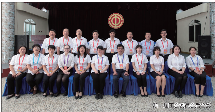
新一届工会委员会合影

要抓好两项建设,促进工会管理水平提升。一是抓好民主管理工作规范化建设。落实“四为”原则,即坚持为职工服务,解决生产生活困难;为党政分忧,夯实企业发展基础;为企业和谐,创建平安稳定环境;为经济加油,促进企业平稳较