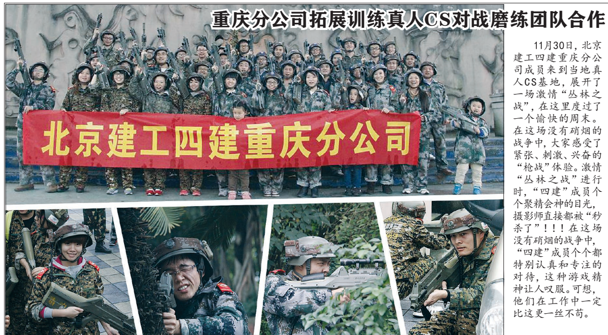
重庆分公司拓展训练真人CS对战磨练团队合作

11月30日,北京建工四建重庆分公司成员来到当地真人CS基地,展开了一场激情“丛林之战”,在这里度过了一个愉快的周末。在这场没有硝烟的战争中,大家感受到了紧张、刺激、兴奋的“枪战”体验。激情“丛林之战”进行时,“四建”成员个个聚精会神的目光,摄影师直接都被“秒杀了”!!!在这场没有硝烟的战争中,“四建”成员个个都特别认真和专注的对待,这种游戏精神让人叹服。可想而知,他们在工作中一定比这更一丝不苟。