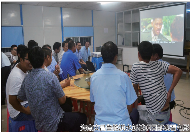
海南文昌鲁能淇水新城项目部观看电影

本报讯 (通讯员 周爱萍 马亚丽 刘佳 邢真) 中秋佳节本是阖家团圆的日子,但有很多坚守一线的员工却因为工作而未能与家人团聚。为排解他们的思乡之愁,公司所属各单位积极组织形式多样的活动让他们度过了一个不一样的中秋佳节。