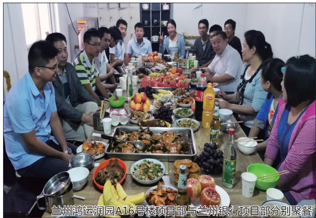
兰州鸿运润园A16号楼项目部与兰州银行项目部分别聚餐