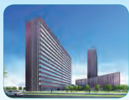
沈阳规划大厦二标段

总建筑面积5.3万平方米,主体建筑包含15层主楼及4层裙楼,集门诊、医疗技术、住院病房等功能于一体,建成后将成为南疆规模最大、标准最高的三级甲等医院。