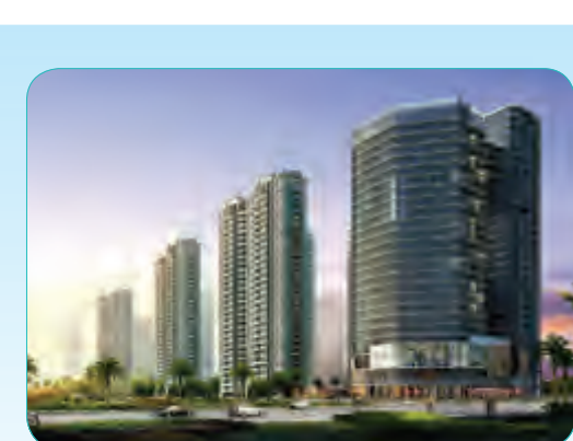
海阔天空·国兴城一期工程

S4地块总建筑面积98,830平方米,地上5栋住宅楼、3#-5#楼有部分2层裙房商业、1层地下车库。S4-1、S4-4、S4-5地上24层,S4-2、S4-3地上32层,本工程质量确保“绿岛杯奖”,力争“鲁班奖”。