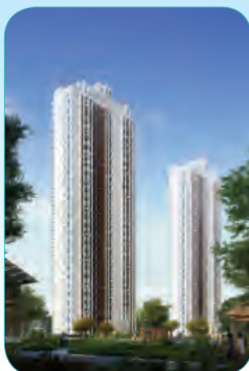
沈阳首开乐活小镇二期第二标段工程

四建公司承建的一标段总建筑面积52608.17平方米,其中质量标准必须达到甘肃省“飞天奖”,工程安全文明标准达到白银市建设工程安全生产、文明施工优良样板工程。