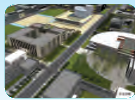
北京邮电大学沙河新校区教学实验综合楼工程

地上由2个子项组成,1栋15层的规划测绘研发中心办公楼,1栋2层的中介服务中心及上述后浇带以东的地下室,建筑面积约3.42万平方米。