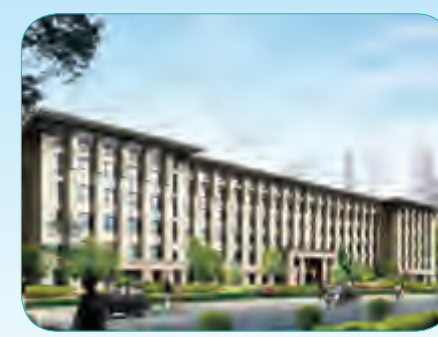
西单、西四、六部口交通队、特勤队及西城区交通执法站综合业务楼工程

总建筑面积37094平方米,工程质量确保“北京市结构长城杯金奖”,2013年7月该工程荣获2013年全国第三批绿色施工示范工程。