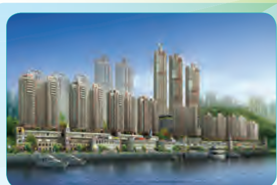
和记黄埔重庆南滨路商住二期后两排总承包工程

建筑面积26.8万平方米,分成1A分区及1B分区两个总承包工程,工程开工日期为2013年2月,1A分区总工期为600天,1B分区总工期为720天。