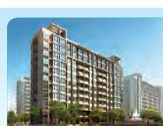
路劲世界城一期工程

海阔天空·国兴城一期工程,共有五个栋号和地连体车库组成,地下一层,地上17至23层不等,主体结构为全现浇钢筋混凝土剪力墙和框架体系,总建筑面积81569平方米。