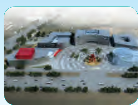
北京市援建和田文化中心工程

总建筑面积45475平方米,包括和田地区图书馆、地区博物馆、歌舞艺术中心、能源中心和地下停车场等,建成后将成为该地区重要的文化建筑新的地标建筑。