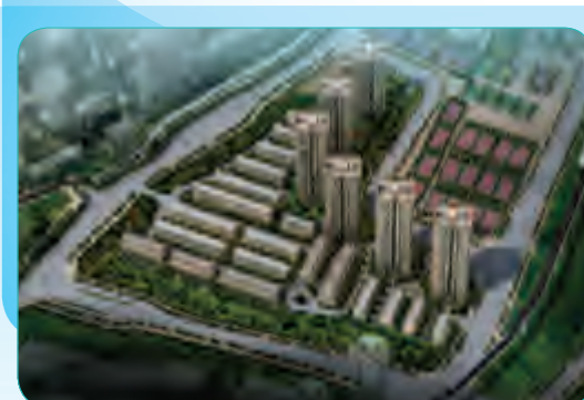
重庆市杨家山片区商住项目(一期)1号地块工程

总建筑面积为59188平方米,大厦主楼地上15层,地下3层,建筑檐高59.4米,是首钢工学院、首钢篮球中心的配套设施,由主楼、多功能厅、能源中心组成。