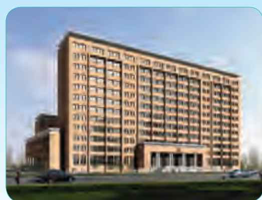
迁安市公安局业务技术用房工程

座落于新疆和田洛浦县北京工业园区内,学校分为一期、二期两个建筑群体施工,总建筑面积为45000多平方米,可满足3000余名学生在校学习。