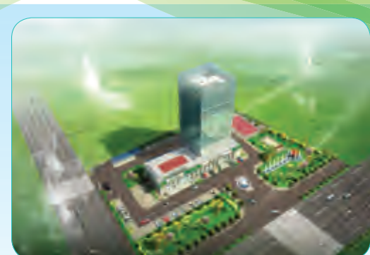
河北玉田县农村信用合作联社营业楼工程

建筑面积100649平方米,共三栋住宅楼,分别为B8高层住宅楼38+1层、B9高层住宅楼41+1层、B10高层住宅楼43+1层,是目前集团历史上最高的住宅楼工程。