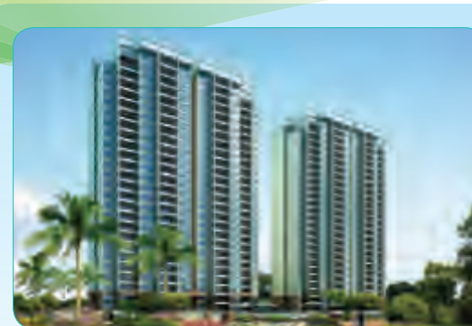
海南广播电视总台职工集资住宅楼工程

位于唐山玉田县,总建筑面积15423.36平方米,其中地上建筑面积12000平方米,地下建筑面积3423.36平方米,该工程荣获河北省唐山市安全文明工地。