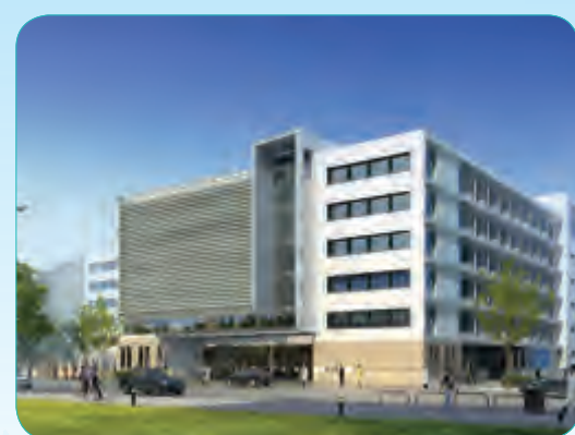
武警北京市总队医院医疗综合楼工程

建筑面积45935平方米,由5个子项组成,包括一栋12层的行政办公大楼,一栋6层技术用房、东西3层配楼和一个大型地下车库,建成以后主要用于行政办公和业务咨询。