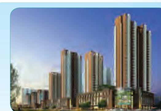
兰州西山—银珠家园住宅小区项目(一标段)工程

位于海南广播电视院内,工程总建筑面积84483.81平方米,由4幢住宅楼及地下室组成,住宅楼高26层,为框剪结构,已于2012年年底实现结构封顶。