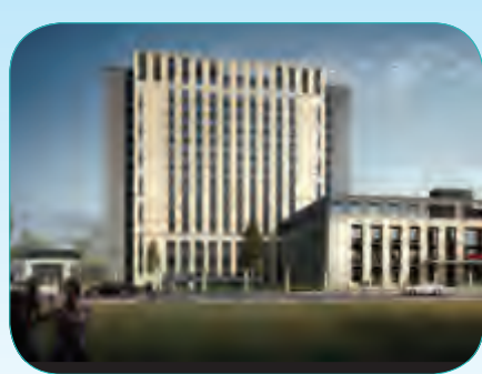
北京援建和田市北京医院工程

总建筑面积45475平方米,包括和田地区图书馆、地区博物馆、歌舞艺术中心、能源中心和地下停车场等,建成后将成为该地区重要的文化建筑新的地标建筑。