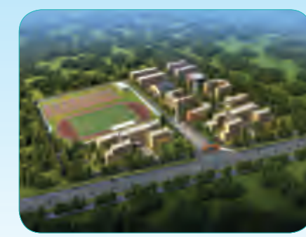
北京援建洛浦北京中学教学示范校工程

总建筑面积为33988平方米,结构形式为钢筋混凝土框架剪力墙结构,质量目标确保“北京市结构长城杯”和争创“北京市建筑长城杯”。