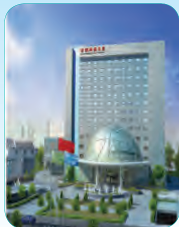
首钢科教大厦工程

总建筑面积约24万平方米,主楼45层,檐高199米,结构形式为混合框架(钢管混凝土柱、钢框架梁—核心筒钢管混凝土)结构,其中钢构总重约为2万吨。