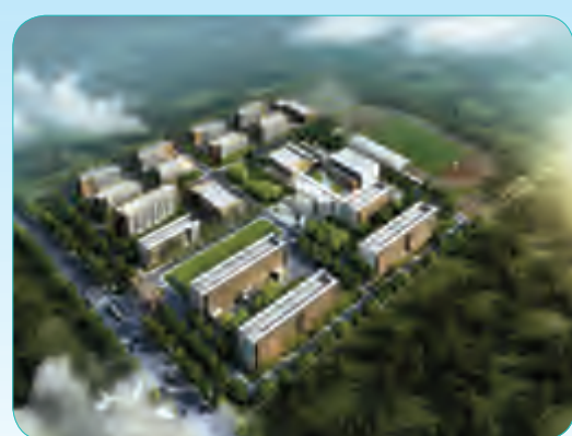
北京援建墨县北京中学工程

位于朝阳区东三里屯一院内,建筑规模27800平方米,地上6层、地下三层,结构为框架剪力墙,檐高23.99米,预计2013年年底竣工交验。