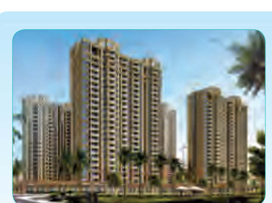
海阔天空国瑞城S4地块总承包工程

由8栋单体结构组成,总面积14万平米,地下2层,地上8层,是集教学培训、科技研发、学术交流、行政管理、配套服务等综合功能于一体的建筑群。