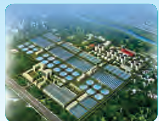
高碑店再生水厂(第二标段)工程

总建筑面积43200平方米,由14项单体工程组成,其中包括3栋教学楼、4栋学生宿舍楼、行政办公楼、3栋多功能楼、教工及学生食堂和配套设施。