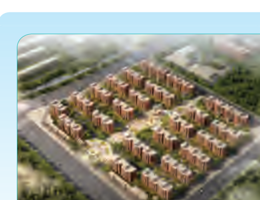
北京援建皮山农场棚户区改造一期、二期工程

该工程位于北京昌平区南邵镇,其中一期工程总建筑面积74425平方米,包括8栋住宅楼及地下车库,工程获得2011—2012年度北京市结构长城杯银质奖和北京市安全文明工地。