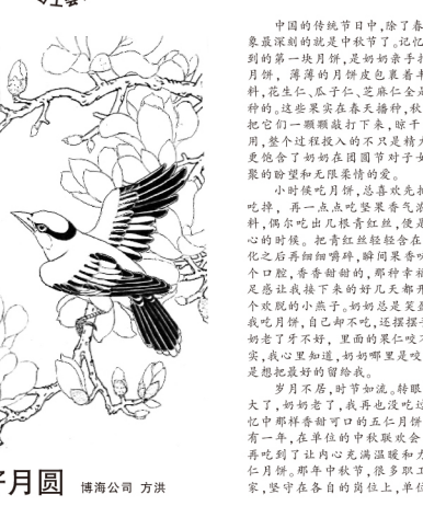
与语共赏明月 方洪

本报讯（通讯员张鑫）近日，苏州地铁6号线07标项目部与辖区街道开展项目共建、施工现场开展共建活动，项目职工以及周边社区居民60余人参加。 活动现场，苏州地铁6号线07标项目部邀请专业人员进行周边社区科普宣传，发放、磨刀、缝补等便民服务，受到了社区居民的欢迎。项目部还搭建了宣传展板，为居民普及地铁建设知识，解答大家的相关问题。此外，项目部举办了有奖竞猜活动，问答