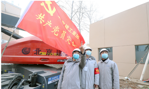
共产党员突击队成员奋战在小汤山工程建设一线。

机施集团闻令而动,成立了党龄一把手队长党员突击队。1月24日除夕之夜,一个个紧急电话打通四面八方。第二天一大早,所有人员全部集合小汤山施工现场,立即投入战斗。