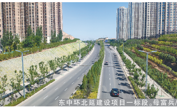
东中环北延建设项目一标段。

本报讯（通讯员杨宇母富兵）近日，由建工路桥集团承建的山西省太原市杏花岭区东中环北延建设项目一标段顺利通过竣工验收。