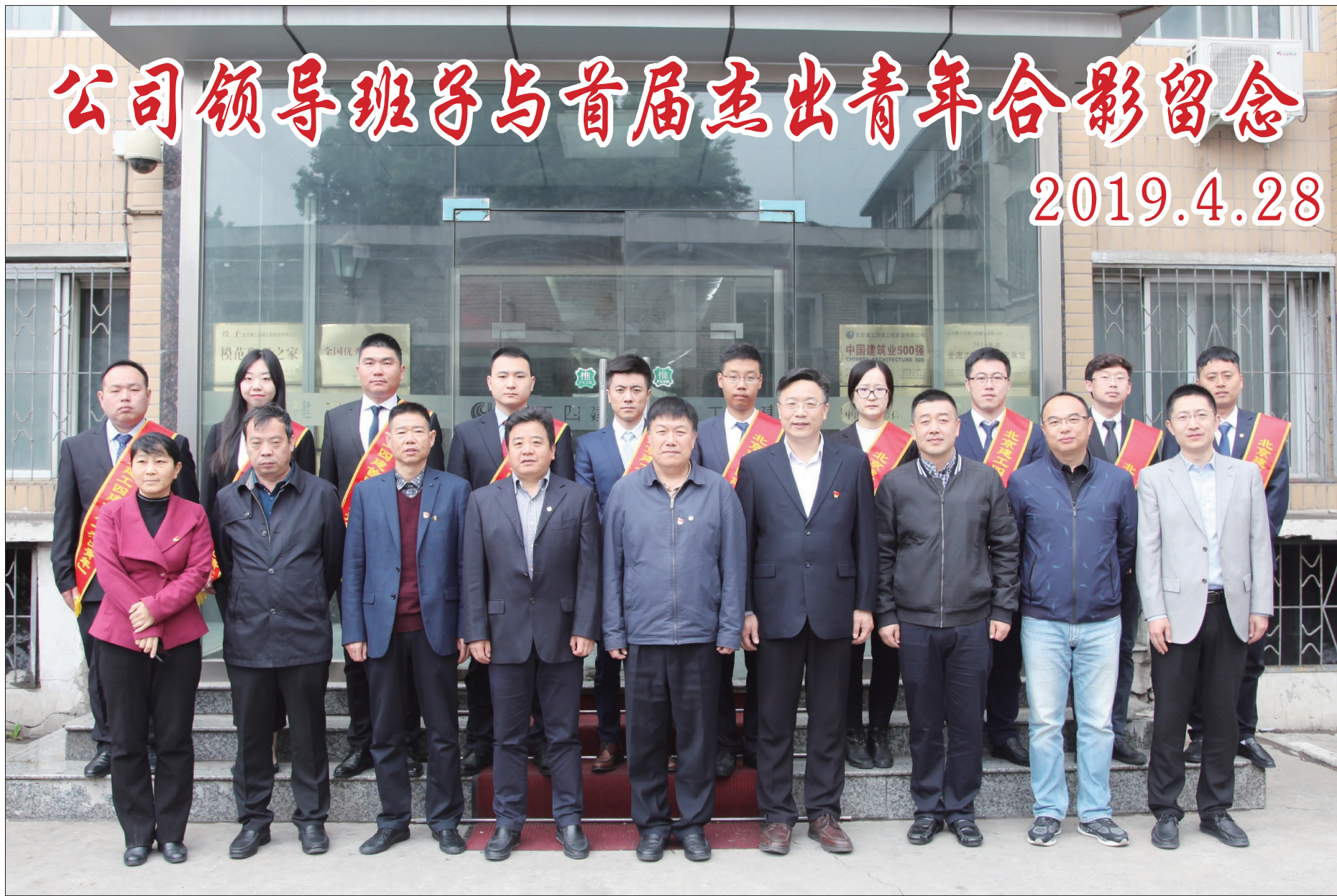
公司领导班子与首届杰出青年合影留念