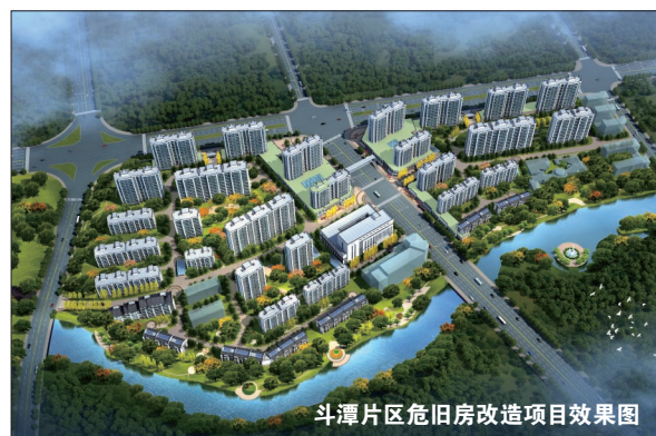
斗潭片区危旧房改造项目效果图

本报讯(特约记者 邵宗瀚 记者 亚明欣)“南孔圣地,衢州有礼。”在衢州的各个角落,记者看到最多的就是这八个字。伴随着绵绵春雨和满眼绿意,更让来到衢州的人们有了宾至如归的感觉。