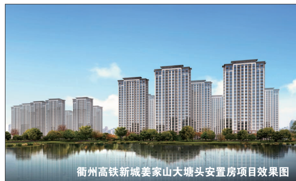
衢州高铁新城姜家山大塘头安置房项目效果图