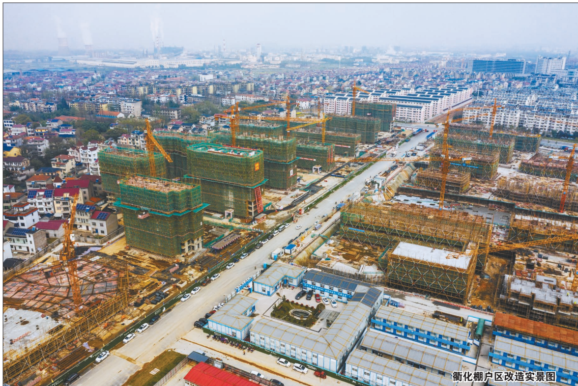
衢化棚户区改造实景图