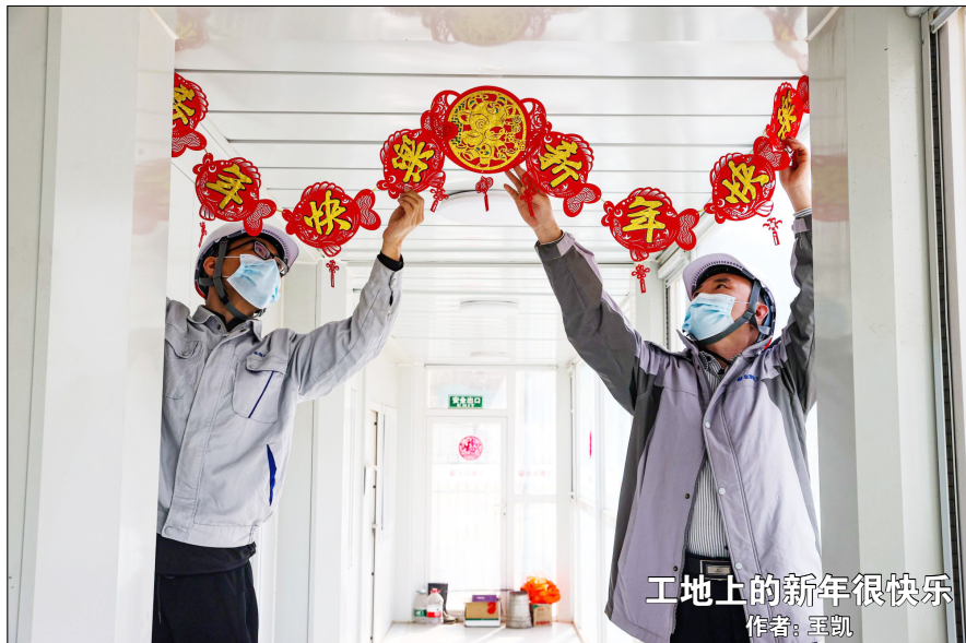
工地上的新年很快乐