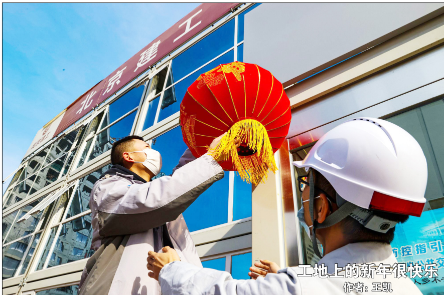
工地上的新年很快乐 作者: 赵凯