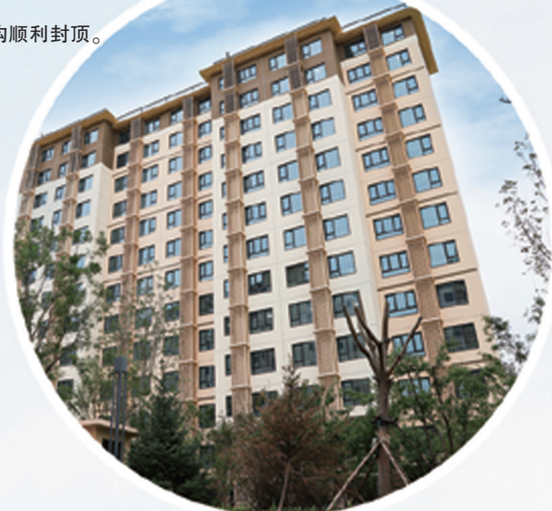
海淀区瑞泽家园项目集中入住交付。

自开工建设以来,项目团队克服了场地施工狭小、工期紧张等诸多困难,合理组织工序,交叉安排作业任务,按期完成了目标节点。接下来,项目将全面进入室内二次结构与装饰装修阶段,预计年底将实现主体外立面全新亮相。