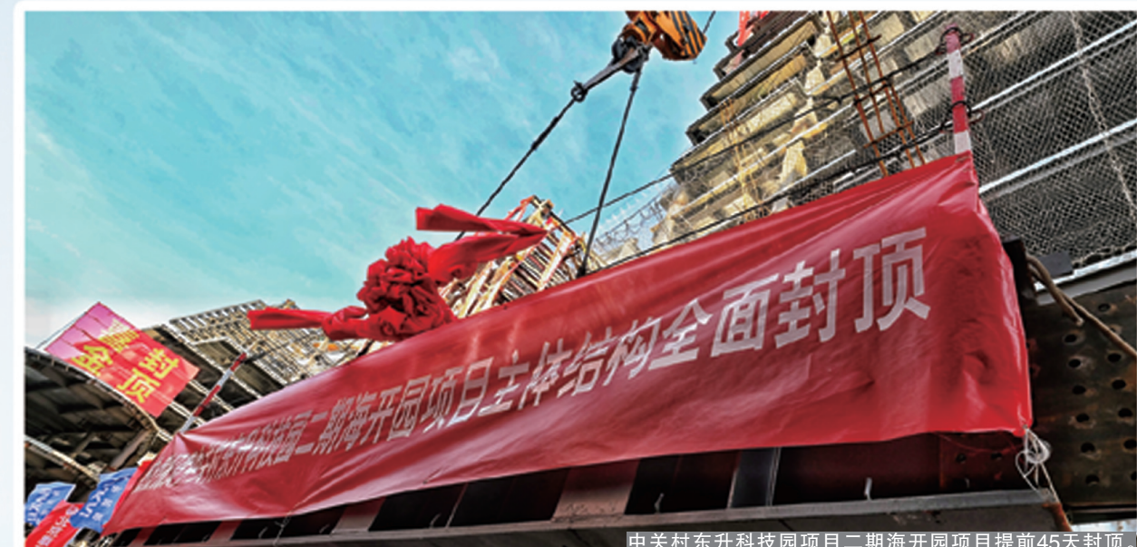
中关村东升科技园项目二期海开区项目提前45天封顶。