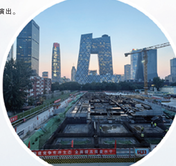
CBD 500千伏输电变电工程主体结构全面跃出地面。

瑞泽家园共有产权房项目位于海淀区西北旺镇,地处海淀北部新区高精尖产业新高地,是中关村科学城北配套功能完善、实现职住平衡的重要载体。项目团队正在以饱满的热情和专业的服务为业主做好交付工作,让业主们安心开启幸福“家门”。