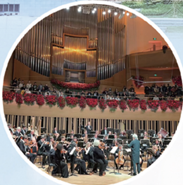
北京艺术中心迎来世界级交响乐团演出。

近期,集团一批重点工程相继迎来开工、封顶、竣工等重大节点,为打好全年目标任务收官战奠定了坚实基础。